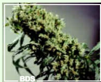
Northern Light x Haze 33,60EUR